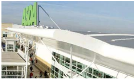
Figuur 5: Gebruik van PUR-sandwichpanelen met stalen oppervlak op een buitenmuur en als dakbedekking van een winkel [14].

Britse vereniging voor producenten van samengestelde panelen met een stalen oppervlak - heeft een brochure opgesteld met een leidraad voor het uitvoeren van een risicobeoordeling van zijn producten [14].