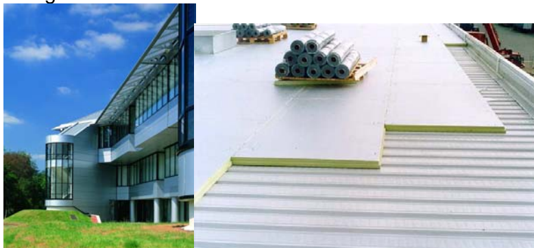
Figuur 1: De externe bekleding van dit openbare gebouw is gemaakt van PUR-sandwichpanelen met stalen oppervlakken en glas.

Vaak gaat de voorkeur uit naar isolatieproducten van polyurethaan, omdat ze significante voordelen bieden op het gebied van isolatiewaarde, veelzijdigheid, licht gewicht etc. Beter thermische isolatie van gebouwen leidt tot significante energiebesparingen en dus tot lagere CO 2 -emissies door verwarming of koeling, lagere energierekeningen en minder gebruik van energiebronnen [2,3,4]. Betere isolatie is een sterke drijfveer voor duurzamere gebouwen, omdat het de efficiëntste factor is om te voldoen aan de toenemende wensen en normen wat betreft energierendement.