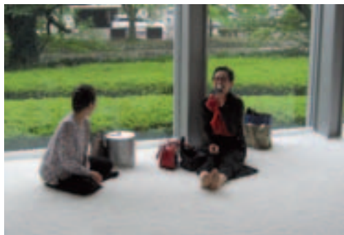
Bezoekers genieten van het witte kunstgras in het Museum voor Moderne Kunst te Kyoto

Kunstgras wordt steeds meer ingezet voor sport- en speelvelden en ook voor landschappelijke toepassingen. Kunst is daar nu aan toegevoegd. De Nederlandse kunstenaar Sibyl Heijnen exposeerde haar objecten op een ondergrond van wit kunstgras in het stedelijk Museum voor Moderne Kunst in het Japanse Kyoto.